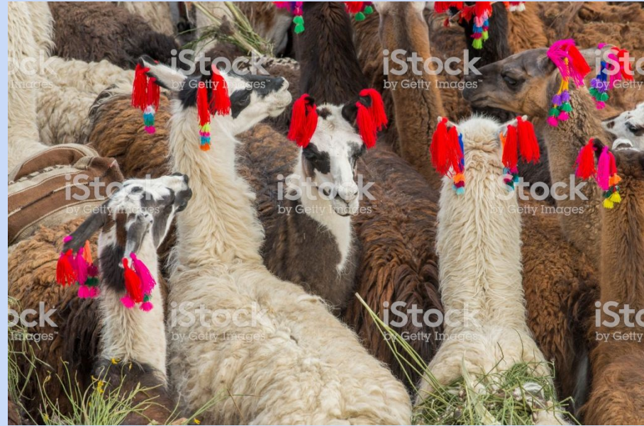
All dressed up for Pascua

Perú's Semana Santa is based from Spanish traditions dating back to the conquest of the Inca Empire (1532). Over time areas such as Cusco, Ayacucho, Huaraz, and Tarma have created noteworthy celebrations.